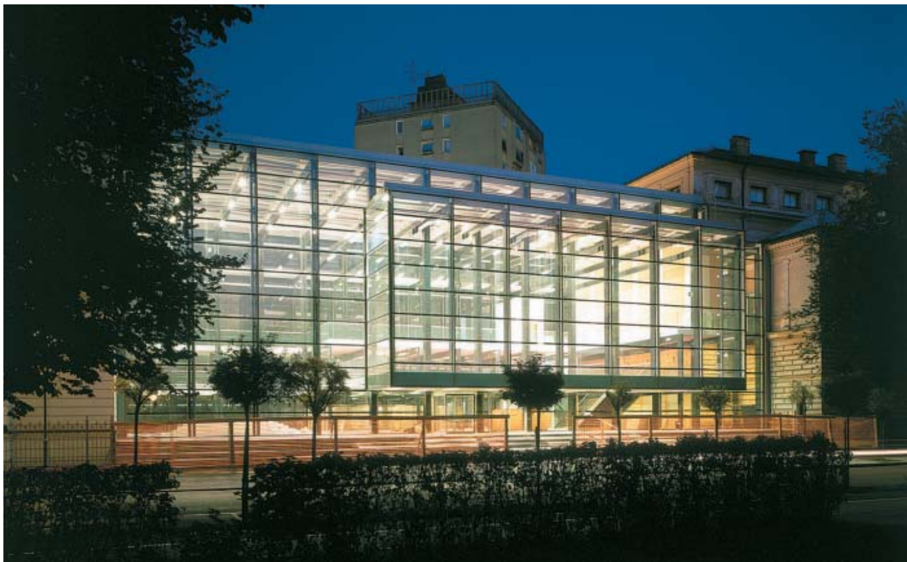
Narodna galerija v Ljubljani